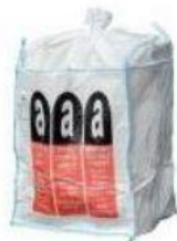
Big bag AZBEST Rozměry 900x900x1100 nosnost: 1.200 kg