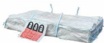
Plochý vak AZBEST Rozměry 2600x1250x300 nosnost: 1.500 kg

Jako obal je možné využít jakýkoliv pevný a neporušený obal (pytel, strečovou folii, sud atd.). Případně je možné, přímo na skládce, zakoupit následující obaly certifikované pro azbest: