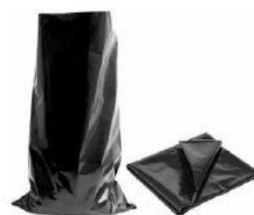
Pytel na AZBEST Rozměry 600x1200 Tloušťka: 0,2 mm

Bližší informace k uložení odpadů či k zakoupení obalů Vám rádi poskytneme na tel. čísle 493 646 416.